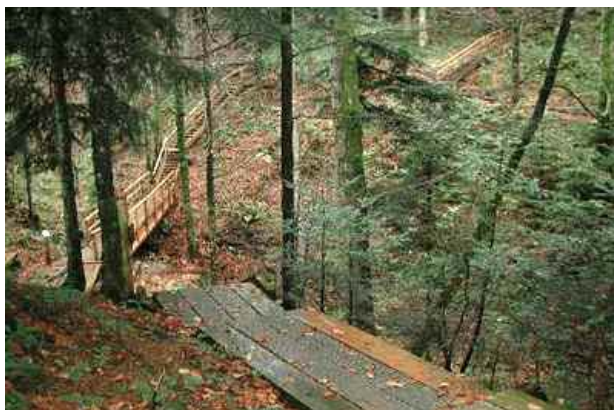
Abb. 3 > Seelensteg Heiligkreuz

Bisher befasste sich die Waldwirtschaft nur am Rande mit der Bedeutung des Waldes für die Gesundheit der Waldbesuchenden. Erkenntnisse aus der Gesundheitsforschung sollten vermehrt für die Gestaltung von typischen Freizeitwäldern genutzt werden. Dies kann etwa durch die Schaffung von Orten der Ruhe und Stille oder durch das bewusste Anlegen von gesundheitsförderlichen Parcours geschehen (vgl. dazu die Ausführungen in Themenblatt 11).